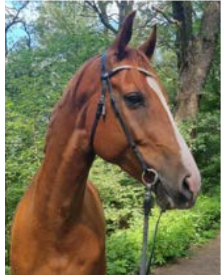
Disco, 8 år

Hjälp oss stoppa smittan genom att desinficera dig och utrustning korrekt och "ta" inte på fler hästar än nödvändigt!